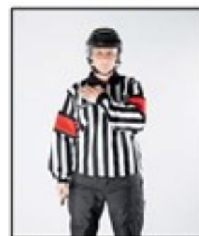
Ulovlig kroppstakling (Kun kvinner / jenter)

Bilder markert med rød ramme er Policyutvisninger og gjelder opp til og med U15 Dette er regulert i Kampreglementet §2-9, totalt 9 forseelser