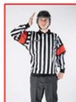
Takling mot hode og nakke