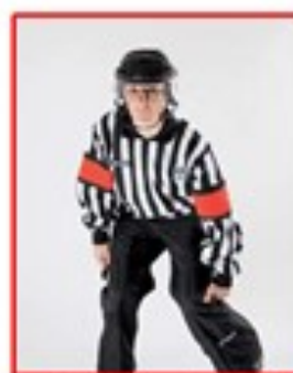
Farlig lav takling Clipping